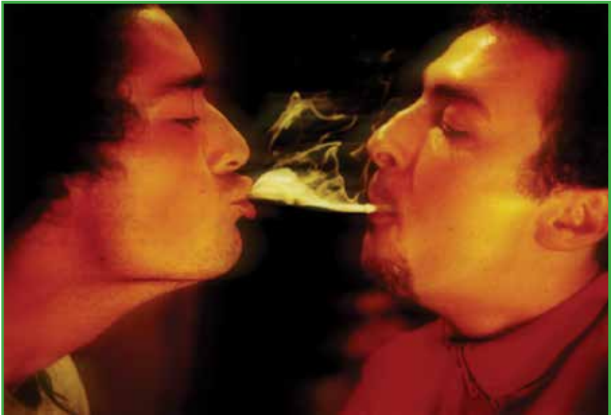
Фотографија бр. 14 Автори: Елеонора Стојановиќ и Игор Андреевски

документираат ритуалните моменти на супкултурата на пушење коноп, прикажувајќи различни варијанти на шотган, односно процесот при пушење на коноп при кој една личност го дува димот од конопот во устата на друга личност. Во заднината на изложбата се репродуцира музика која го надополнува просторот во кој публиката беше активен учесник и можеше да интервенира симултано. Во најавата за овој настан е наведено дека станува за проект кој го документа и го слави процесот на комуникација која не познава сексуално, етничко и културно ограничување. Комуникација која не морализира, туку искушува, предизвикува. Овој настан се случува во периодот кога околу Македонија беснеат војни и еден ваков настан посветен на културата на употреба на конопот во која се слават принципите на заедништво и толеранција претставува и своевиден бунт кон војната и омразата. Неколку фотографии од овој настан се искористени како илустрации во оваа книга.