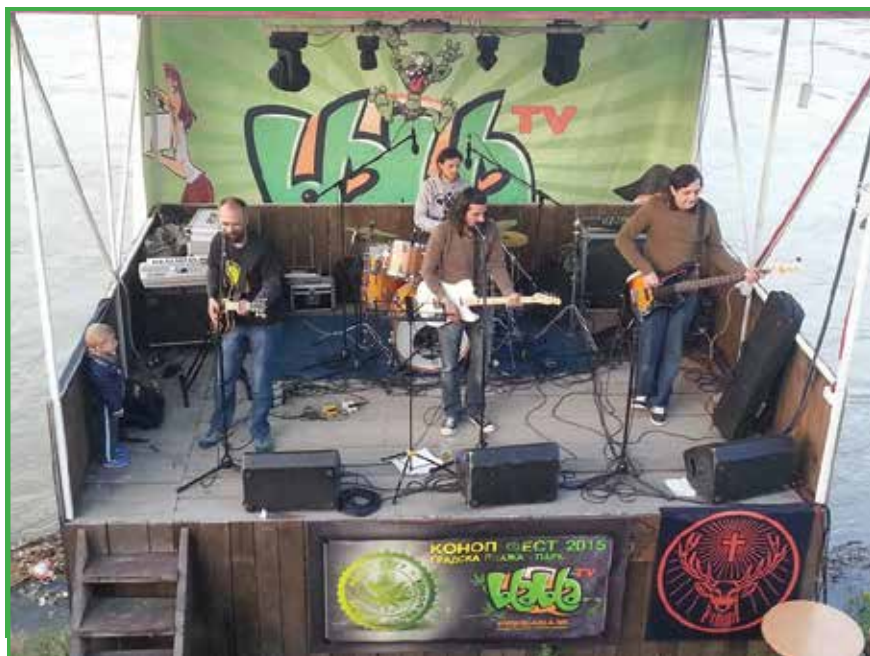
Фотографија бр. 17 Автори: Првиот КОНОПФЕСТ, 2015 г., Скопје. Автор: Жарир Симрин

Во 2015 година, група на граѓани го организираа првиот КОНОПФЕСТ во Скопје. Се одржа на 19 април и во првите утрински часови од 20 април, Денот на конопот, кога во повеќе држави се организираат маршеви за негова легализација. На овој КОНОПФЕСТ настапија повеќе македонски бендови и диџеи, а целиот настан беше сниман од БЛА БЛА телевизија. Од 2018 година, КОНОПФЕСТ продолжи да го организира Здружението за канабис и зелени политики „Билка“.