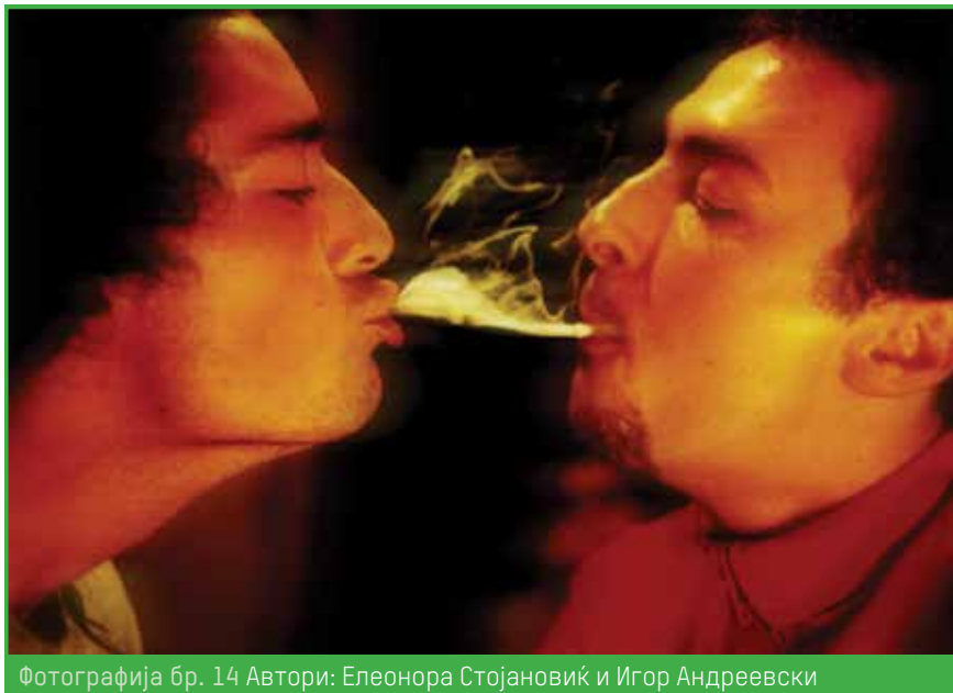
Фотографија бр. 14 Автори: Елеонора Стојановиќ и Игор Андреевски

документираат ритуалните моменти на супкултурата на пушење коноп, прикажувајќи различни варијанти на шотган, односно процесот при пушење на коноп при кој една личност го дува димот од конопот во устата на друга личност. Во заднината на изложбата се репродуцира музика која го надополнува просторот во кој публиката беше активен учесник и можеше да интервенира симултано. Во најавата за овој настан е наведено дека станува за проект кој го документира и го слави процесот на комуникација која не познава сексуално, етничко и културно ограничување. Комуникација која не морализира, туку искушува, предизвикува. Овој настан се случува во периодот кога околу Македонија беснеат војни и еден ваков настан посветен на културата на употреба на конопот во која се слават принципите на заедништво и толеранција претставува и своевиден бунт кон војната и омразата. Неколку фотографии од овој настан се искористени како илустрации во оваа книга.